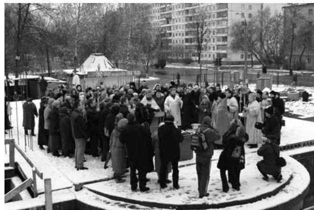
Закладка Камня в основание храма.

Конечно, тогда трудно было себе представить, что через два года здесь встанет этот храм. Но это случилось, и вот уже три года мы в нем служим. Произошло великое чудо. Я хочу подчеркнуть, чтобы мы не заблуждались: наших личных заслуг здесь нет. Как всякое чудо — это милость Божия, которая всегда проявляется к радости, к детской радости с ликованием. Так произошло и с нами. Когда ребенок