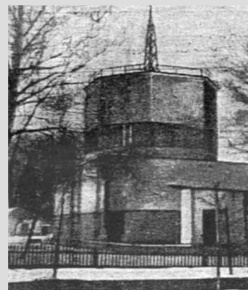
В 1933 г. здание церкви было превращено в радиоузел