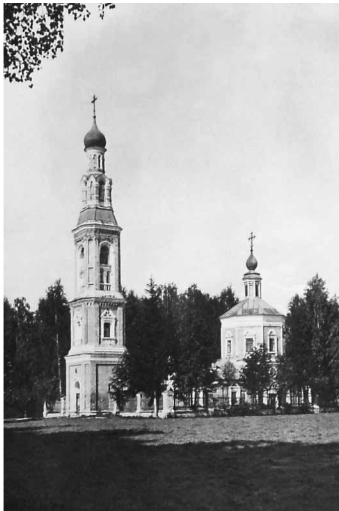
Храм Рождества Пресвятой Богородицы. Фото 1912 года.

Наша местность лежала на пути из Владимирско-Суздальского княжества в Киев и далее в Византию. Здесь проходил волок из Клязьмы в Язу. Позднее наши земли граничили с владениями Чудова монастыря и великокняжеским Ловчим путем.