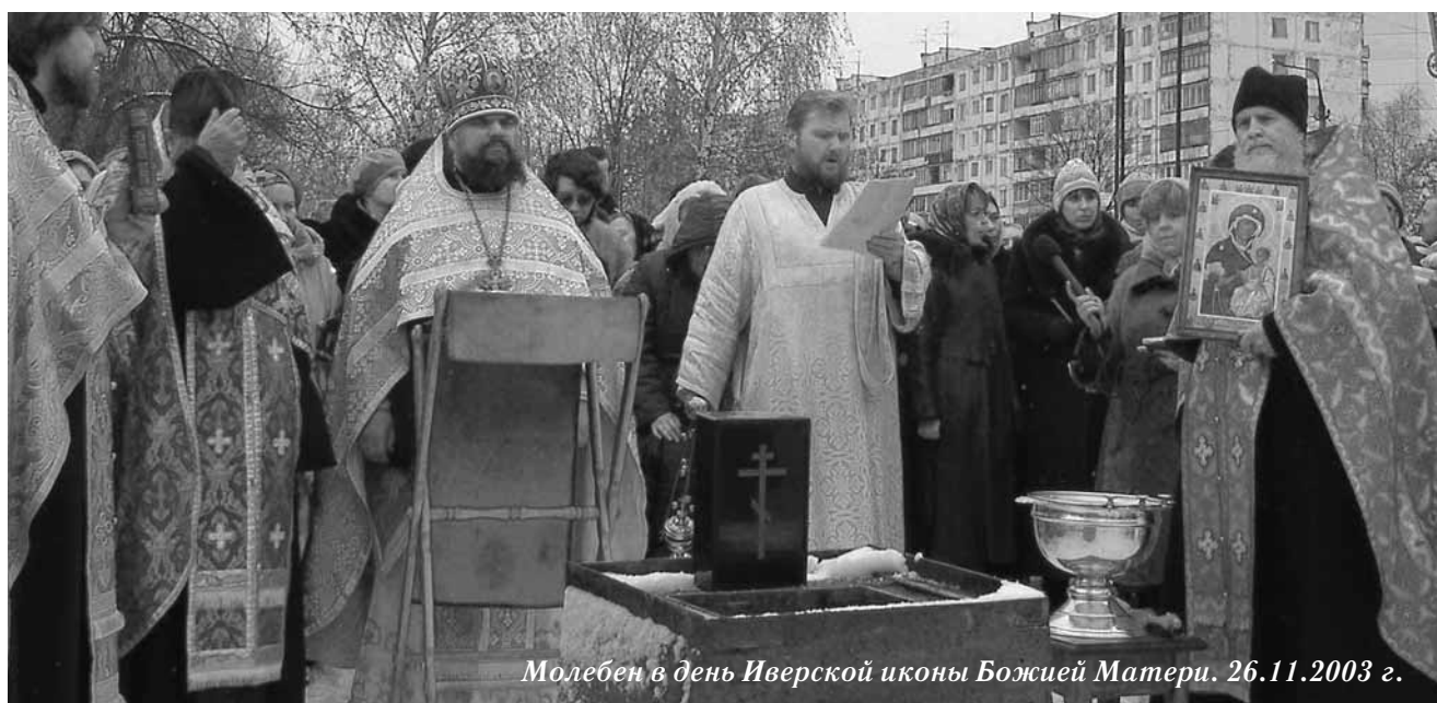
Молебен в день Иверской иконы Божией Матери. 26.11.2003 г.

в колыбельке лежит, и ему протягивают игрушку, он не понимает, кто ему ее дал, а просто радуется. Дети повзрослее тоже радуются всякому даянию, потому что знают духом, что «всякое даяние благо есть». Вот так и мы радуемся по-детски и ликуем, что мы ничего не сделали. Сам Господь, Его Пречистая Мать в честь иконы Своей Иверская дали нам нашими грешными руками воздвигнуть это величественное здание. Наш храм стал украшением города и нашим домом духовным. Причем случилось это так ненавязчиво, так невзначай! Поэтому наше сегодняшнее моление — благодарение. У нас столько помощников в мире невидимом! 14 июля 2003 года святые мученики римские Косма и Дамиан в день их памяти позволили нам приступить к началу строительства. А через три месяца, как я уже сказал, состоялась закладка Камня. Мы молились, чтобы этот Камень превратился в церковь.