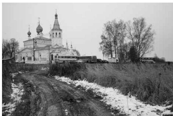
Церковь Иоанна Златоуста в Годеново.

Первая остановка была сделана в Антушково — в месте, где в 1423 году был явлен Животворящий Крест Господень. Антушково находится на границе между Ярославской и Ивановской областями. Сейчас здесь располагается монастырь Сошествия Креста.