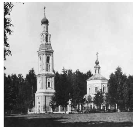
Газета «Коммунар», №4 от 5 декабря 1933 г.