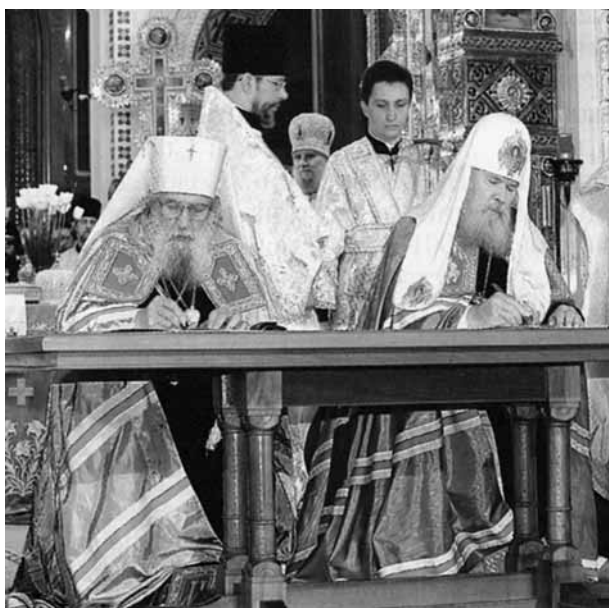
Подписание Акта о каноническом общении 17 мая 2007 г.

Главное направление международной деятельности Русской Православной Церкви определялось в эти годы тем, что решение многих