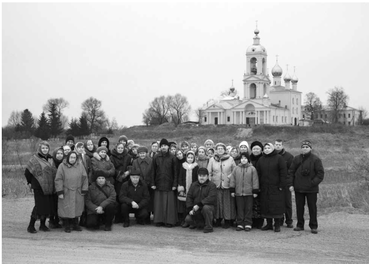
Церковь Воздвижения Честного и Животворящего Креста Господня в Антушково.

Предание рассказывает, как пастухи, увидев среди болот столб света, направились к его источнику. Пробираясь по топям, они наконец узрели Распятие Господне, рядом с которым стоял Чудотворец Николай с Евангелием в руках. Люди услышали Глас, повелевший соорудить на этом месте Дом Божий: в нем будут совершаться чудеса и исцеления. Однако когда с благословения архиерея приступили к строительству, оказалось, что на указанном месте храм заложить нельзя из-за трясины. Здание начали строить на берегу топи, но на следующее утро основание церкви оказалось стоящим прямо на болоте, на указанном месте, и рядом с ним вторично был явлен Животворящий Крест. Болотная же вода образовала поток и ушла бесследно. Долго простояла на том месте перевозданная церковь Николая Чудотворца, но потом случился пожар, спаливший её дотла. Однако Крест, сотворенный из липового дерева, на месте пожара был найден невредимым. Храм был отстроен, и в нём вновь водрузили Крест, творивший многие чудеса и исцеления.