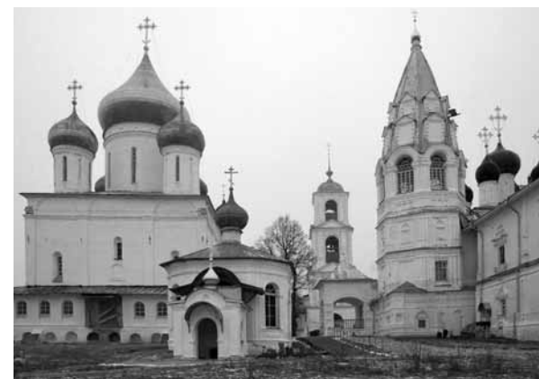
Никитский монастырь. На переднем плане часовня над местом подвига прп. Никиты Столпника.

научитесь делать добро, ищите правды, спасайте угнетенного, защищайте сироту, вступайтесь за вдову.» (Ис. 1:16-17), вызвали перемену в Никите, и он удалился в монастырь, где, по данному игуменом послушанию, три дня стоял у ворот и исповедовал входящим свои грехи. Приняв постриг, Никита выкопал яму, поселился в ней, надев на себя вериги и каменную шапку. Уже при жизни Никита Столпник прославился исцелениями и изгнанием бесов. Святой был убит злоумышленниками, решившими, что пудовые его вериги отлиты из серебра. Поняв, что ошиблись, злодеи выкинули их в реку, но вериги поплыли по воде. Сейчас их можно увидеть в Благовещенской церкви монастыря. Паломники поклонились мощам преподобного, многие возложили на себя его вериги.