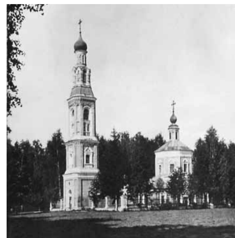
Газета «Коммунар», № 4 от 5 декабря 1933 г.