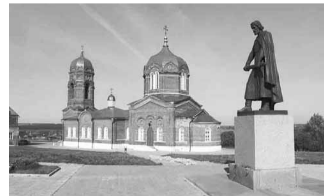
Храм Преподобного Сергия Радонежского близ поля Куликова

Блаженная Матрона (Никонова) родилась в 1885 году в этом селе в семье бедных крестьян. Девочка была слепой от рождения, но ей с детства были даны дары духовного рассуждения, прозорливости, непрестанной молитвы, чудотворения и исцеления. Число исцеленных и наставленных на путь истинный жителей родного села, окрестных тульских земель, а также Москвы, куда она переехала в 1925 году, измерялось тысячами. Несмотря на слепоту и телесную немощь (в 17 лет у нее отнялись ноги), Матрона принимала до сорока человек в день. Скончалась блаженная в 1952 году, была погребена на Даниловском кладбище, где сейчас ее могила — одно из мест массового паломничества.