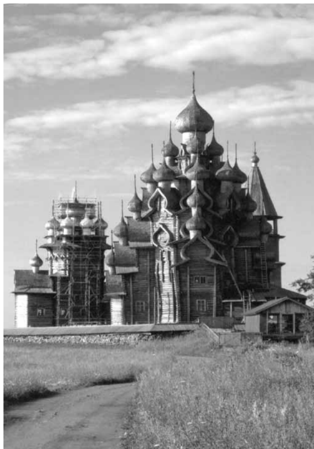
Архитектурный ансамбль Кижского погоста. В центре — церковь Преображения Господня, слева — храм Покрова Богородицы, справа — колокольня.

Преображенская церковь представляет тип восьмериковых ярусных храмов. Основа композиции — восьмигранный сруб с четырьмя ступенчатыми прирубам, расположенными по сторонам света. Восточный, алтарный, прируб имеет форму пятиугольника. С запада к основному сруб примыкает невысокая трапезная. Формы и размеры