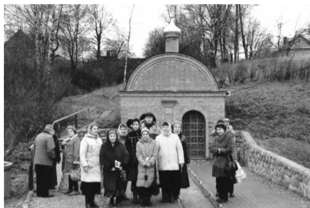
В селе Талицы

только стоя. При раскопках был обнаружен источник. Его облагородили, и сейчас там колодец — подходи, черпай прохладную, живительную влагу!