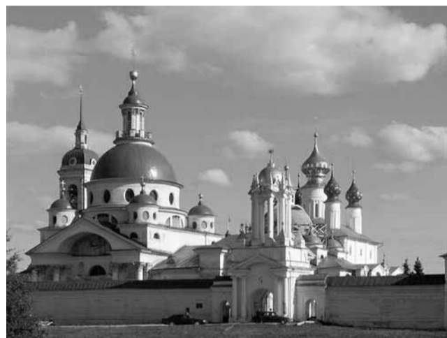
Ростов Великий. Спасо-Яковлевский монастырь

Целью очередной паломнической поездки приехавшие к нашему храму избрали Ростов Великий. В 6 утра мы уже ехали по «дороге паломников», как называли в XIX веке Ярославское шоссе. Сначала посетили Спасо-Яковлевский Димитриев мужской монастырь, где отслужили панихиду по приснопоминаемому Патриарху Алексию II.