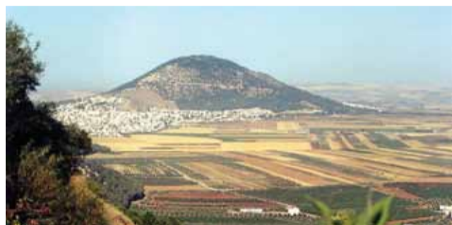
Вид на Фавор с Галилейских гор, со стороны Назарета. Весна — время уборки хлеба

«По прошествии дней шести, взял Иисус Петра, Иакова и Иоанна, брата его, и возвел их на гору высокую одних, преобразился пред ними: и просияло лице Его, как солнце, одежды же Его сделались белыми, как свет. И вот, явились им Моисей и Илия, с Ним беседующие. При сем Петр сказал Иисусу: Господи! хорошо нам здесь быть; если хочешь, сделаем здесь три кущи: Тебе одну, и Моисею одну, и одну Илии. Когда он еще говорил, се, облако светлое осенило их; и се, глас из облака глаголющий: Сей есть Сын Мой Возлюбленный, в Котором Мое благоволение; Его слушайте. И, услышав, ученики пали на лица свои и очень испугались. Но Иисус, приступив, коснулся их и сказал: встаньте и не бойтесь. Возведя же очи свои, они никого не увидели, кроме одного Иисуса» (Мф. 17:1-8).