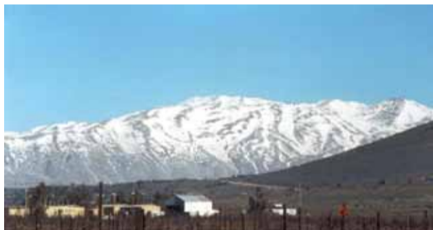
Гора Ермон, вид с Галилейских высот

Ермон — самая высокая гора на территории Палестины, покрытая вечными снегами. Отсюда берет свое начало река Иордан.