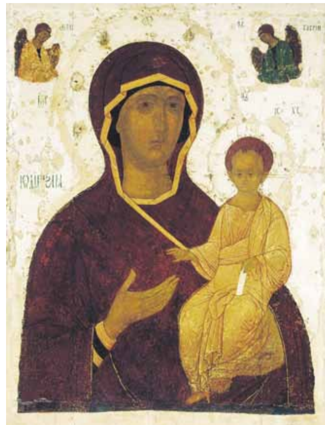
Смоленская икона Божией Матери. Дионисий, 1482 год

На Смоленской иконе Божией Матери, именуемой «Одигитрия», что значит «Путеводительница», мы видим Божию Матерь, правая рука которой указывает на Богомладенца Христа, восседающего на левой руке. Изображения строгие, прямолинейные, головы Христа и Пречистой Девы не касаются друг друга. Богородица как бы говорит всему человеческому роду, что путь истинный — это путь к Христу. На этой иконе она предстает путеводительницей к Богу и вечному спасению.