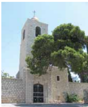
Колокольня и ворота православного монастыря на вершине Фавора

Православный греческий женский монастырь Преображения Господня расположен в северо-восточной