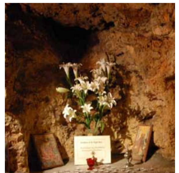
Место Рождества Пресвятой Богородицы

Несколько позднее греки стали строить здесь здание своего консульства и в нижнем этаже, с помощью России, создали скромную церковь Рождества Пресвятой Богородицы; церковь расположена направо от входа, за стеклянной дверью. Здесь же, направо, прямо