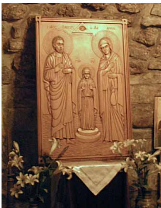
Икона – Богоотцы Иоаким и Анна с Пречистой Девой Марией

Святой праведный Иоаким, сын Варпафира, был потомком царя Давида, которому Бог обещал, что от семени его потомков родится Спаситель мира. Праведная Анна была дочерью Матфана и по отцу была из колена Левина, а по матери — из колена Иудина. Супруги жили в Назарете Галилейском. Они не имели детей до глубокой старости и всю жизнь скорбели об этом. Им приходилось переносить презрение и насмешки, так как в то время бесчадие считалось позором. Но они никогда не роптали и только горячо молились Богу, смиренно уповая на Его Волю.