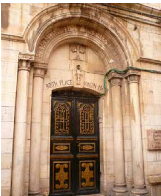
Вход в монастырь, построенный, по православному преданию, на месте дома святых Иоакима и Анны, в котором родилась Богородица. Старый город Иерусалима, около Львиных ворот. Принадлежит Иерусалимской православной церкви

По преданию, родители Пресвятой Девы жили в Иерусалиме, недалеко от Овчих (Львиных) ворот. На месте их дома св. Царица Елена построила храм, подвергшийся разрушению одновременно с другими. Неоднократно восстанавливаемый христианами после различных разорений, ко времени крестоносцев он представлял собою маленький бедный монастырь.