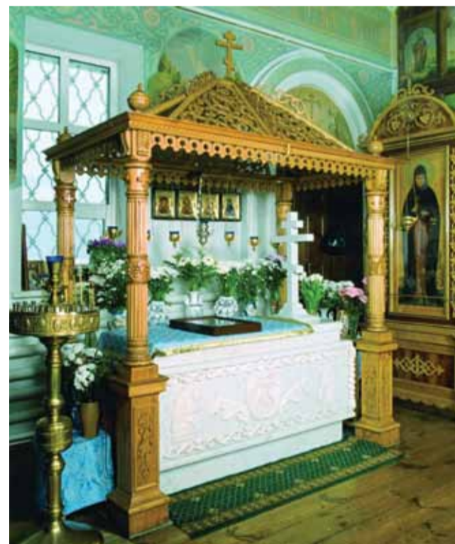
Рака над мощами блж. Евфросинии в церкви Казанской иконы Божией Матери в Колопановском монастыре

Подвиг юродства Христа ради — самый тяжелый подвиг стяжания святости. Старица Евфросиния питалась лишь хлебом да квасом, спала — самую малость — на голых досках, носила на шее тяжелую железную цепь и непрестанно молилась. Она обладала даром прозорливости. Блаженные часто прозревали будущее, являя это и своим внешним видом. Евфросиния, например, остригла волосы, словно зная, что придет время, когда девушки, женщины лишатся своих кос. Вместо них нынче — модные стрижки... А ведь коса — «девичья краса», честь и достоинство женщины! Старица Евфросиния к тому же ходила в штанах, как мужчина. И вот сейчас чуть ли не все женщины носят брюки, джинсы. А ведь мужская одежда для женщины — «мерзость перед очами Господа»! Разве невеста наденет брюки? Слава Богу, этого еще нет. На венчание принято облачаться в белое платье, символ чистоты и непорочности. Но, возможно, скоро появятся и невесты в брюках! Да что молодежь, сколько старушек ходит в штанах, объясняя, что так теплее! А ведь тысячи лет Православная Русь носила красу-сарафан.