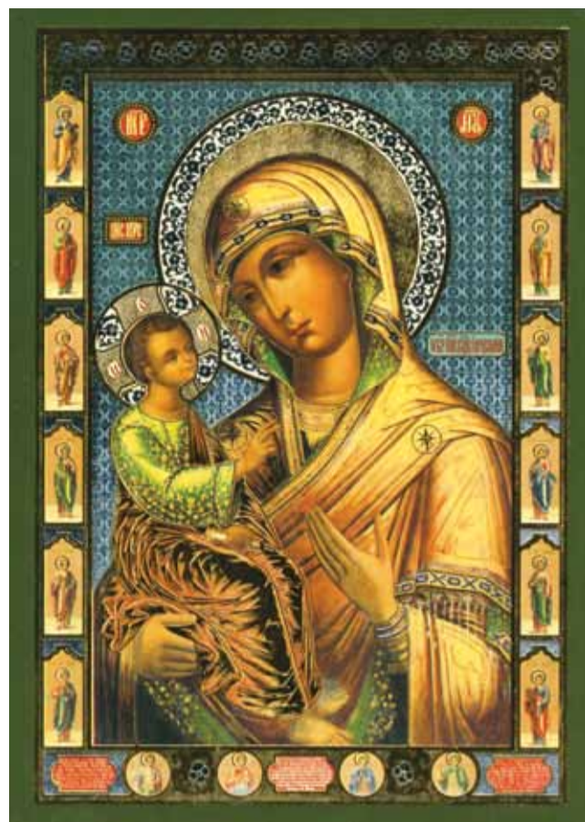
Иерусалимская икона Божией Матери

Иерусалимская икона Божией Матери, по преданию, была написана в 15-й год по Вознесении Господнем, в Гефсимании, и была первой из всех образов Богородицы, созданных святым Евангелистом Лукой. Предназначалась икона для иерусалимской общины. По некоторым свидетельствам, именно этот образ, находившийся некогда в храме Воскресения Христова в Иерусалиме, явился той чудотворной иконой Богородицы, от которой изшел глас к преподобной Марии Египетской, обративший ее от греховного пути.