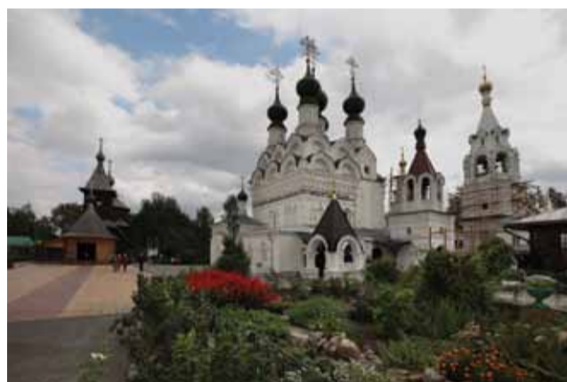
Свято-Троицкий женский монастырь в г. Муроме

В великий день Погребения Божией Матери мы отправились в Муром, к благоверным князьям Петру и Февронии, посетили храм Николая Набережного, где почивают мощи праведной Иулиании. Поклонились и чудотворному образу Божией Матери «Скоропослушницы».