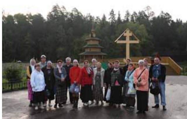
У источника прп. Серафима Саровского

Меж тем Канавку Божией Матери украсили цветами. Крестный ход сестёр монастыря идёт по цветочному ковру с Богородичными иконами. По