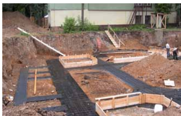
30 июля 2003 г. Разбивка котлована, начало бетонных работ.