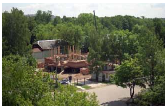
Июнь 2004 г. Начало кирпичной кладки