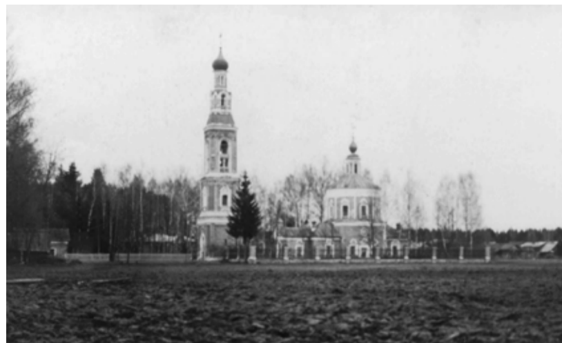
Разрушенная Богородицерождественская церковь. Вид с юга