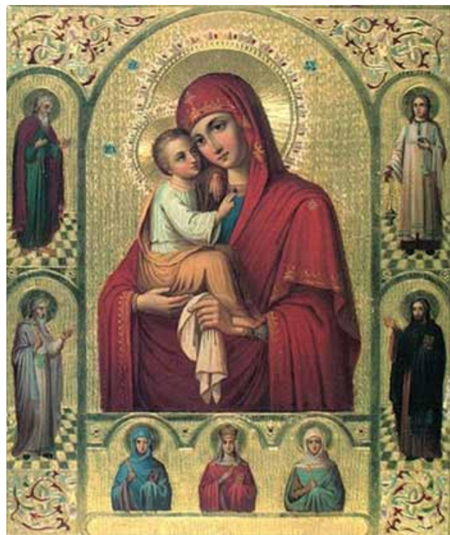
Чудотворная икона «Всех скорбящих Радость» в Преображенском храме на Ордынке в Москве.

Не часто людям случается доставить радость даже близким своим. Сколько же надо любви, милости и силы, чтобы доставить радость всем? И кто может горе, скорбь людей переменить на радость? Святая Церковь свидетельствует, что Божия Мать Единая есть в этом Помощница. Издавна православный народ с любовью называет Ее – Радостью все скорбящих. «Не имамы иныя помощи, не имамы иныя надежды, разве Тебе, Владычице». На твердой и глубокой вере в Небесное предстательство Божией Матери, на многочисленных свидетельствах благодатной помощи Пресвятой Богородицы всем, с верой прибегающим к ней, и основан освященный Православной Церковью обычай писать иконы «Всех скорбящих Радость». Божия Мать изображается на этих иконах обычно во весь рост, иногда с Предвечным Младенцем на руках. Главную особенность икон «Всех скорбящих Радость» составляет изображение на них людей, страждущих от болезней или скорбей житейских. Между страждущими часто изображаются Ангелы, раздающие благоденствия от имени Богоматери. В свидетельство безграничной милости Пресвятой Богородицы и твердого упования в заступничество Ее за православных христиан, в разных местах икон помещаются слова из молитвы к Божией Матери: «Алчущих Кормительнице», «Нагих одеяние», «Больных исцеление» и др. Одна из таких икон прославилась в Москве 24 октября 1688 г.