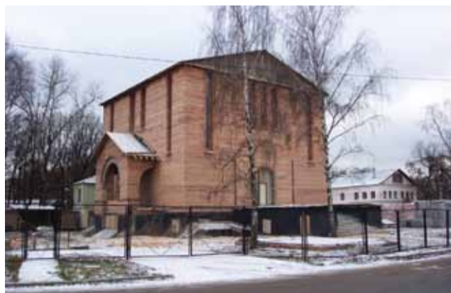
Ноябрь 2004 г. Завершение второго строительного сезона