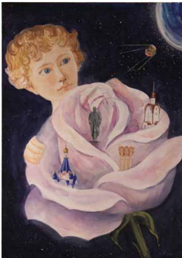
Т.А. Лизунова «Цветку, который ты любишь, ничто не грозит»

и красочной золотой осенью, и суровой поздней. Лишь ни одного зимнего не нашла я среди этих пейзажей (что и понятно, выйти на пленер в наши русские морозы — сродни подвигу).