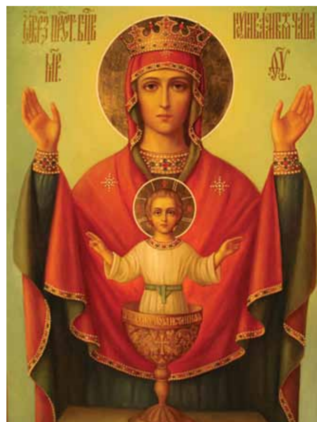
Икона Божией Матери «Неупиваемая Чаша»

Чудотворная икона Божией Матери «Неупиваемая Чаша» была явлена во Владычнем монастыре города Серпухова в 1878 году.