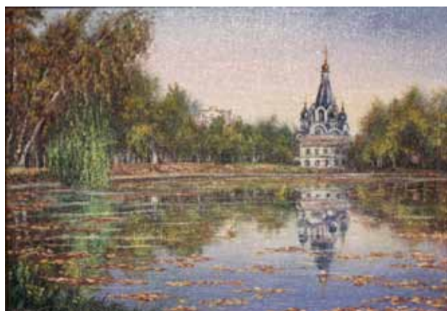
И.В. Козьмина Богородицерождественский храм

Но какие из королёвских церквей прежде всего привлекают взор живописцев? Судя по конкурсной экспозиции, первенство тут, безусловно, за нашим храмом! Храм Рождества Пресвятой Богородицы в Костино изображен на девяти представленных на выставке работах (всего их 80, стало быть, чаще, чем на каждой десятой). А ведь это — самый молодой храм города, и «позирует» он художникам не более пяти лет. Видимо, его стройный, гармоничный силуэт, синий шатер и золотые купола не оставляют равнодушными людей с художественной жилкой. И, конечно, играет роль живописное расположение церкви на берегу пруда, ведь изображение ускользающего, зыбкого отражения здания в воде — увлекательная для художника задача!