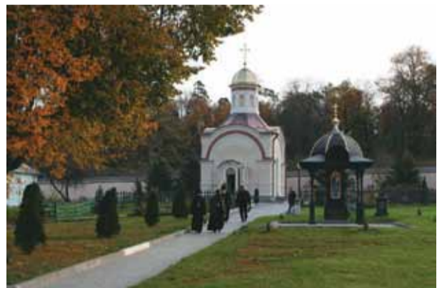
Часовня на месте погребения убиенных оптинских братьев

честь Преображения Господня возведен в 2007 году Часовня на месте погребения убиенных оптинских братьев: иеромонаха Василия, иноков Трофима и Ферапонта построена в 2008 году на монастырском кладбище в юго-восточной части монастыря.