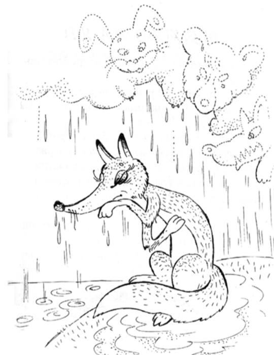
Рисунок Вячеслава Полежаева

Увидала его лиса, подпрыгнула, не достала и побежала вдогонку.