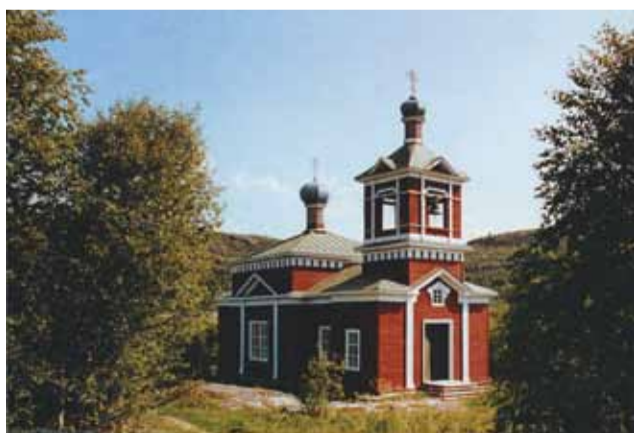
Церковь во имя святых Бориса и Глеба на Кольском полуострове

Одна из моих командировок лет двадцать назад привела меня на Кольский полуостров. Там я погожим летним днем на самой российско-норвежской границе, а если быть точным, на норвежской стороне, посетил скромный храм. Стоит он на святом месте. Еще в 1565 году преподобным Трифоном, основателем Печенгского монастыря, тут была построена небольшая церковь во имя святых Бориса и Глеба. Ныне существующее здание построено