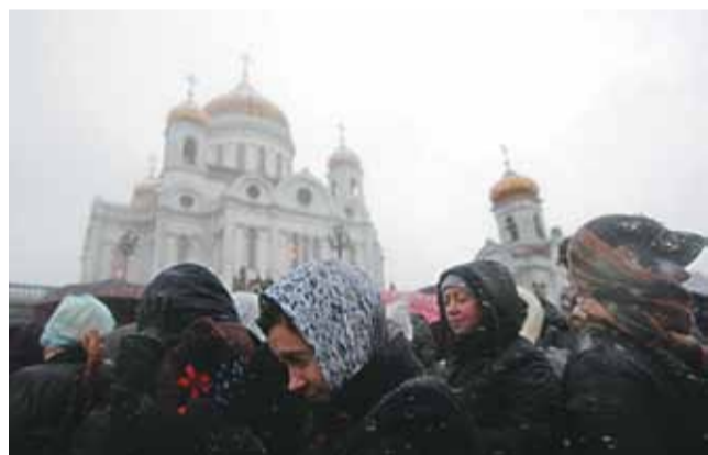
«Вот уже и Храм виден»