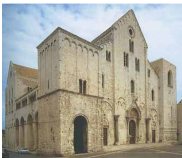
Собор во имя святителя Николая в Бари

Относительно недалеко от острова Корфу, всего в семи часах хождения (правда, по двум морям – Ионическому и Адриатическому), уже на итальянском берегу в городе Бари находится Собор во имя святителя Николая, которого нам привычнее называть Николаем Чудотворцем. Святой является воплощением милосердия и человеколюбия, заботы и защиты для слабых. Святитель Николай особенно почитаем в России.