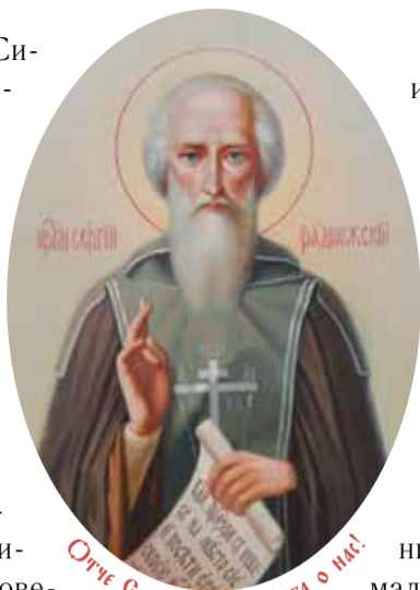
Отче Сергие, моли Бога о нас!

Событие, которое мы вспоминаем сегодня, произошло в 1170 году. К этому времени православие уже утвердилось на Руси. Вера в Пресвятую Троицу и в жизнь будущего века — господствующая религия. Однако быть православным в уме — не то же самое, что быть православным в сердце. Даже после примерного подвига святых благоверных князей, братьев Бориса и Глеба, первых на Руси добровольных христианских страстотерпцев, еще далеко было до исполнения их преемниками самой главной заповеди Христа о любви к Богу и ближнему, как к самому себе. Наоборот, летопись доносит: в течение еще нескольких веков удельные князья боролись друг с другом, каждый за свой корыстный интерес, уповая лишь на свои собственные силы или на помощь друзей. В этой обстановке благоверный князь Андрей Боголюбский, ныне святой, подговорил соседних князей смоленского, ростовского и прочих, чтобы покорить Великий Новгород, взяв его под свое влияние.