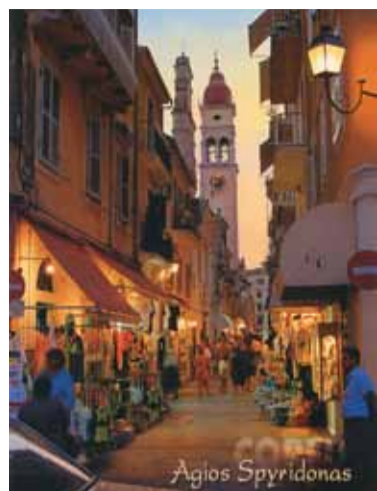
Колокольня и церковь свт. Спиридона в Керкире (остров Корфу)

Окончание. Начало на предыдущей странице