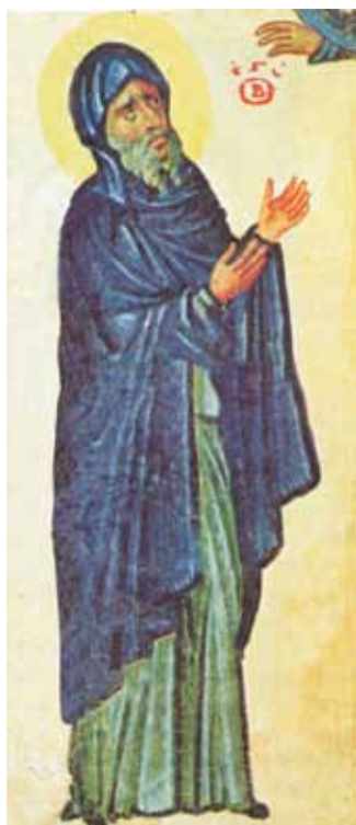
Прп. Ефрем Сирий

какова благодать Господа? — Не в руки князя или военачальнику предана ты, как осужденная. Не скорби, что не стало у тебя богатства. Не стыдись обратиться, но скажи лучше: восстав, иду ко Отцу моему (Лк. 15, 18). Восстань, иди. Он примет тебя и не укоряет, а паче радуется твоему обращению. Он ждет тебя, только не стыдись, как Адам, и не скрывайся от лица Божия. Ради тебя Христос распялся и отринет ли тебя? Да не будет сего! Он знает, кто утесняет нас; знает, что нет у нас другого помощника, кроме Его одного. Христос знает, что человек беден. Итак, не будем предаваться нерадению, как уготованные в огонь. Христу нет нужды ввергать в огонь; не приобретение для Него — послать нас в мучение.