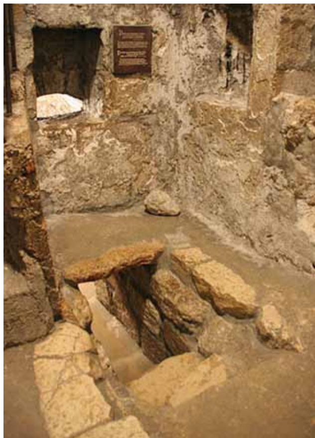
Гробница Лазаря Четверодневного

После Вифании мы поспешили в свой храм в Горнем и торжественно справляли Вход