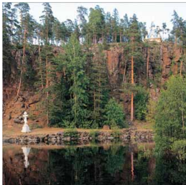
Поклонный крест и Вознесенская часовня у Малой Никоновской бухты

Сирени белой царственные грозди, Как белые одежды, говорят, Что мы на Валааме — только гости, Быть гостем в этом мире каждый рад. И, как в раю положено, все дали Становятся бескрайни и светлы, Особенно когда защебетали Малиновки и шустрые щеглы. И птиц безгрешных слыша щебетанье, Ему внимает, растворясь в тепле, Скит Гефсиманский, как напоминанье На Заозерье о Святой земле.