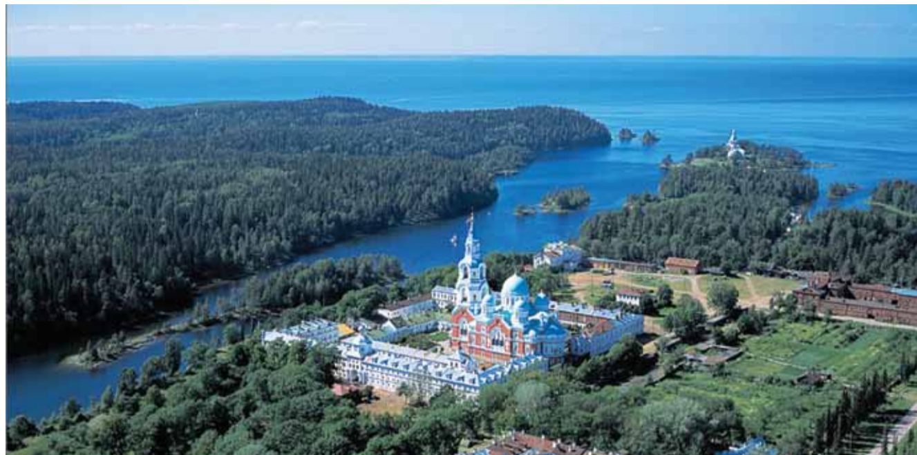
Главная усадьба монастыря