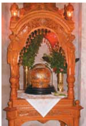
Глава апостола Тита под митрой

Деятельность Тита на Крите недостаточно известна, т.к. не сохранились древние официальные и проверенные сведения о первом периоде Критской церкви. Позднее здесь сложилась устная легенда о житии первого епископа. По этой легенде, Тит был хорошо образованным критянином знатного происхождения, род которого восходит к мифическому критскому царю Миносу.