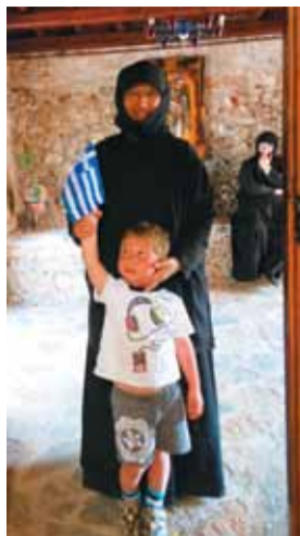
Монахиня и Иоанн

Едем дальше по горной дороге. Монастырь Благовещения Пресвятой Богородицы Куфи Петра — ещё выше. Основан в начале XVII века и недавно частично отреставрирован. К северу от монастыря сохранились развалины древнего храма в углублении скалы, отсюда, видимо, и название Куфи Петра (глухой камень).