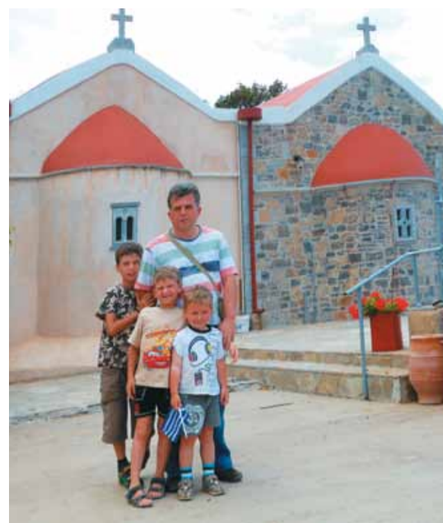
Монастырь Благовещения Пресвятой Богородицы Куфи Петра

Улетали мы из Греции ранним утром. Из отеля в аэропорт ехали на такси с пожилым греком за рулем. В машине работало радио — по радио звучали утренние молитвы (на греческом, разумеется). Когда утреннее правило закончилось и началась музыка, водитель радио выключил. Бывают же такие таксисты!