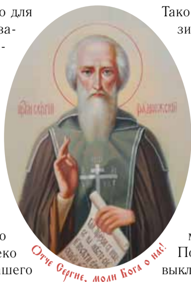
Отче Сергие, моли Бога о нас!

А вот мы не слышим, как нам говорит Господь то же самое: встань и ходи прямо. Мы не можем этого слышать, потому что оглоушены своим собственным шумом, а лучше сказать — шумом противника Божьего в наших ушах. Что это за шум? Это жажда наживы, славы, наслаждений. И кто противник Божий, мы тоже хорошо знаем. Это дьявол, который сознательно лишает нас способности слышать и следовать на зов Божий.