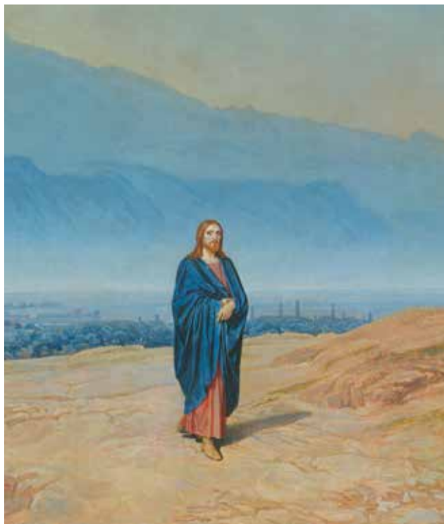
Фрагмент картины А.А. Иванова «Явление Христа народу»

Часто приходится слышать: «Мне помогает Бог. Я это чувствую. Столько раз помог!» А почему помогает? — не задумываемся. Да, любит! Но не до «без конца» же! Видимо, чего-то ждёт. Чего же Бог ждёт от нас? Исправления? Безусловно.