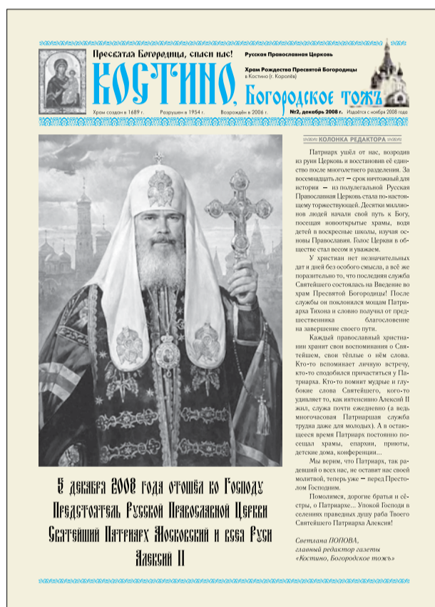
Номер, посвящённый памяти Святейшего Патриарха Алексия II