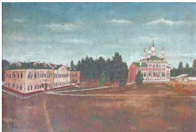
Так выглядел Кылтовский монастырь в начале XX века