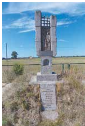
Памятник жертвам ГУЛАГа

В соборе смонтировали в четыре яруса, тепловые каналы отопительной системы залили бетоном, опасаясь побегов. Кирпичный сестринский корпус также стал тюрьмой. По чудовищной издѣвке властей Кылтовский монастырь стал узилищем для множества священников и мирян, пострадавших за веру. Многие из них