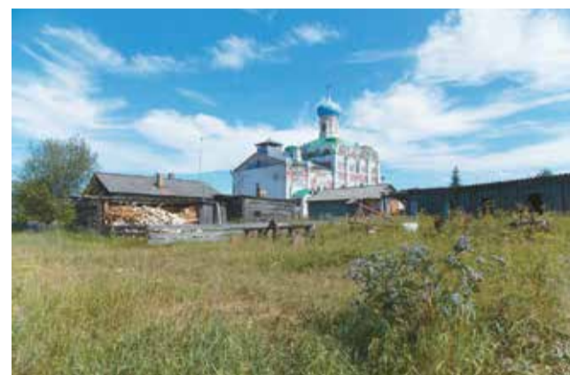
Храм Соловецких чудотворцев Зосимы и Савватия виден издали