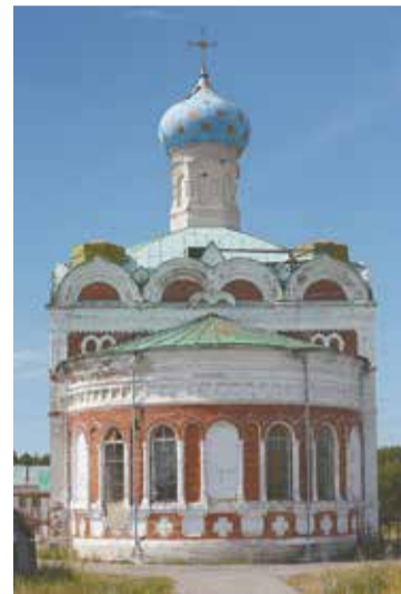
Собор Соловецких чудотворцев Зосимы и Савватия

и Савватия – прекрасное здание в византийском стиле. Сохранившееся и поныне, оно было закончено в 1912 году. Пятиглавый собор высотой 38 метров отапливался по новой системе, с помощью калориферной печи и тепловых каналов в стенах. Храм украшал 11-метровый резной дубовый иконостас. Появились также сестринский корпус с пристройками, дома для священников, гостиница, избы для рабочих, амбары, скотные дворы, мастерские (гончарная, ковровая, керамическая, швейная, иконописная и др.). Художественные изделия монахинь и трудников Кылтовского Крестовоздвиженского