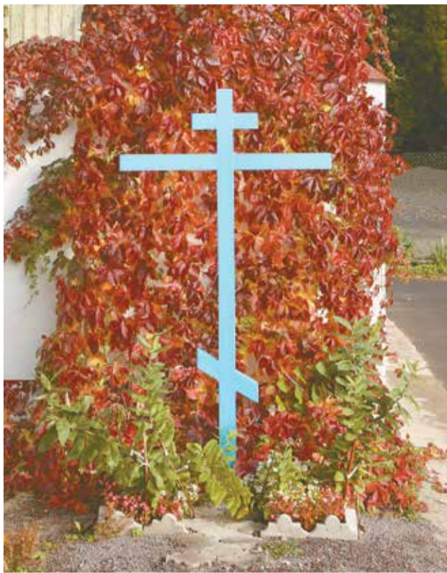
Крест у храма. 2010 г.

В этот же день ныне вспоминается ещё одно событие, связанное с Крестом Господним. В 628 году Крест Господень был возвращён в Иерусалим из