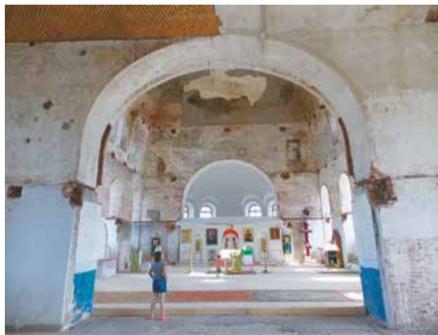
До конца реставрации ещё далеко

Возрождение монастыря началось в 1995 году, когда в обители поселились несколько монахинь во главе с настоятельницей, игуменью Стефанидой. Восстановление идет нелегко, ведь в этих малолюдных местах нет большого количества состоятельных жертвователей. Но в 2009 году для восстановления Крестовоздвиженского