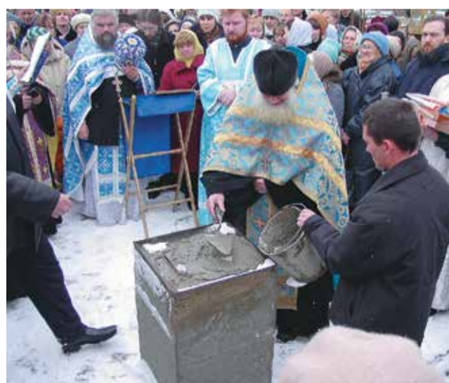
Завершение Закладки Камня