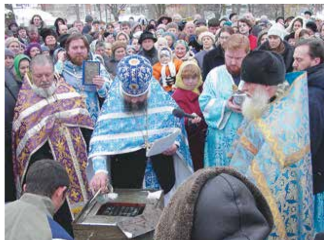
Благочинный освящает Камень святым елеем