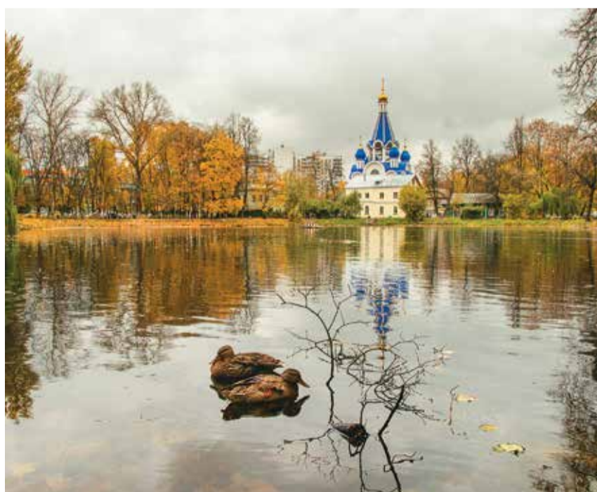
В Костино, 2013 г.

Старый парк раздался и раздвинулся Оттого, что первый лист слетел. Красный клён, как будто подосиновик, На грибной поляне заалел. Будут листья пламенеть до случая, Когда ветры жадно их сорвут, И уже потом дожди тягучие, Как грибные шляпки, соберут.