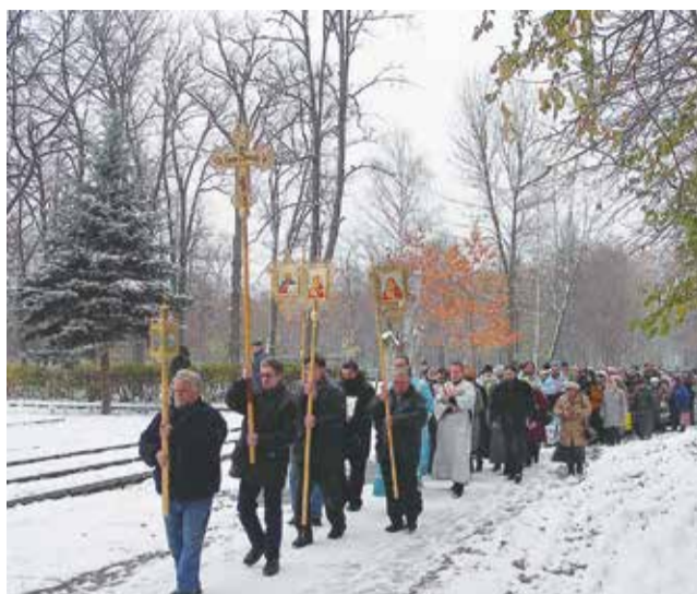
Крестный ход из временного помещения храма направляется к возрождающемуся храму

— В тот день праздничную воскресную Литургию возглавил благочинный церковью в ту пору Пушкинского, ныне Ивантеевского округа протоиерей Иоанн Монаршек в сослужении духовенства города.