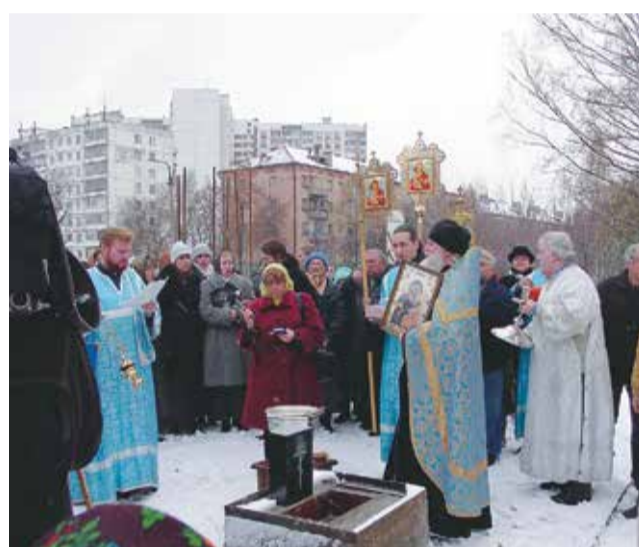
Соборная молитва перед Закладкой Камня