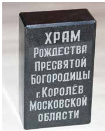
Камень в основание Престола

«Когда мы делаем все, что зависит от нас, тогда в обилии получаем помощь Божию». Святитель Иоанн Златоуст