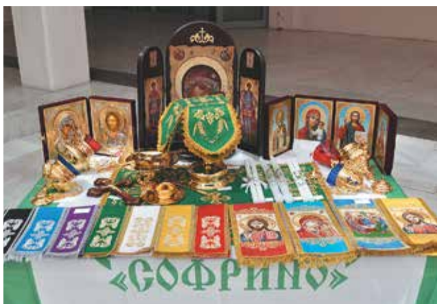
Продукция ХПП «Софрино»

видуальному заказу. Многие не могли сдержать восторженных возгласов при виде этого великолепия, настолько красивы экспонаты музея.