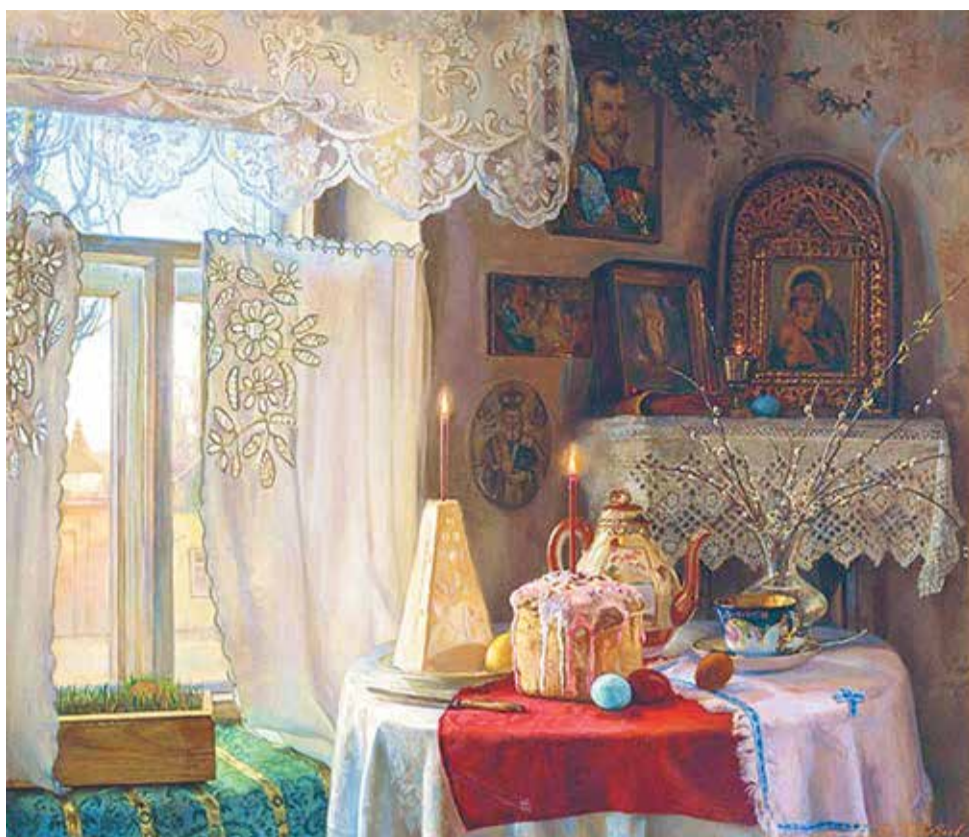
Илья Каверзнев «Светлое Воскресение»

— Ангели поют на не-бе-си-и... Таинственный свет, святой. В зале лампы только. На большом подносе — на нём я могу