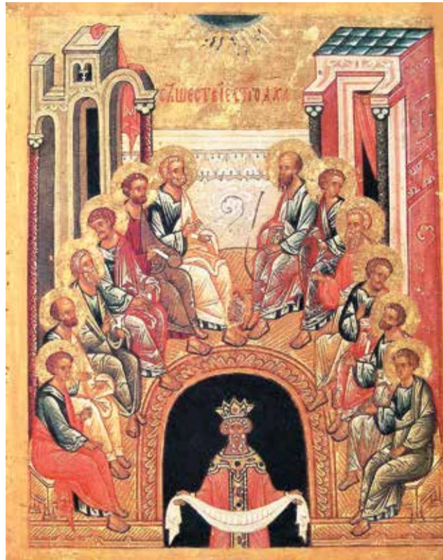
Сошествие Святого Духа. Рубеж XV-XVI вв. Неизвестный русский иконописец

Но это участь неверующего или сомневающегося человека. Для верующего нет одиночества! Он с Богом! Бог никогда не предаст и не «отлучится» от него. То есть будет здесь,