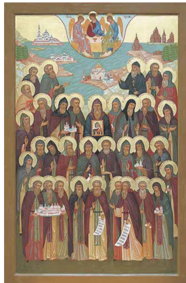
Собор Карельских святых

Главные святыни храма: Владимирская икона Божией Матери, подаренная собору Патриархом Алексием II, икона святого благоверного князя Александра Невского, преподнесённая в дар собору вместе с богато украшенным киотом работниками Онежского тракторного завода, икона Карельских святых, мощевик с частицами мощей Киевских и других чудотворцев.