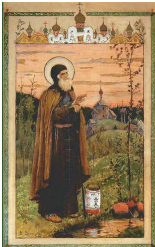
В. М. Васнецов «Преподобный Сергей Радонежский»

И внял Господь мольбам святого (Вы только вдумайтесь на миг!) — Чудотворящим стало слово — Забил в глуши живой родник!