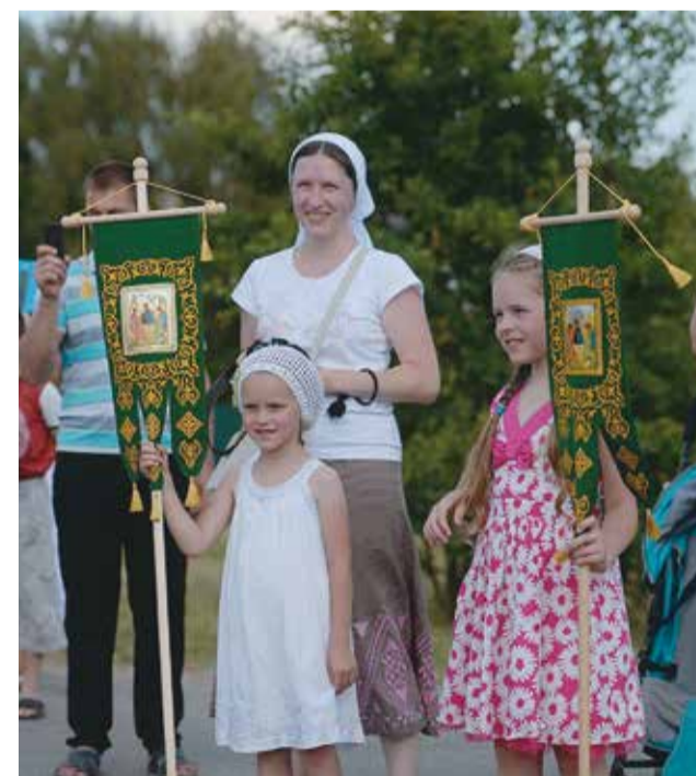
Радовались все от мала до велика