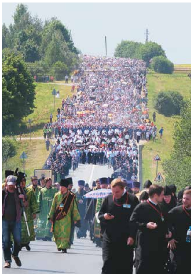
Тысячи паломников со всей России

Это было грандиозное шествие людей, мужественно шагнувших под палящим солнцем