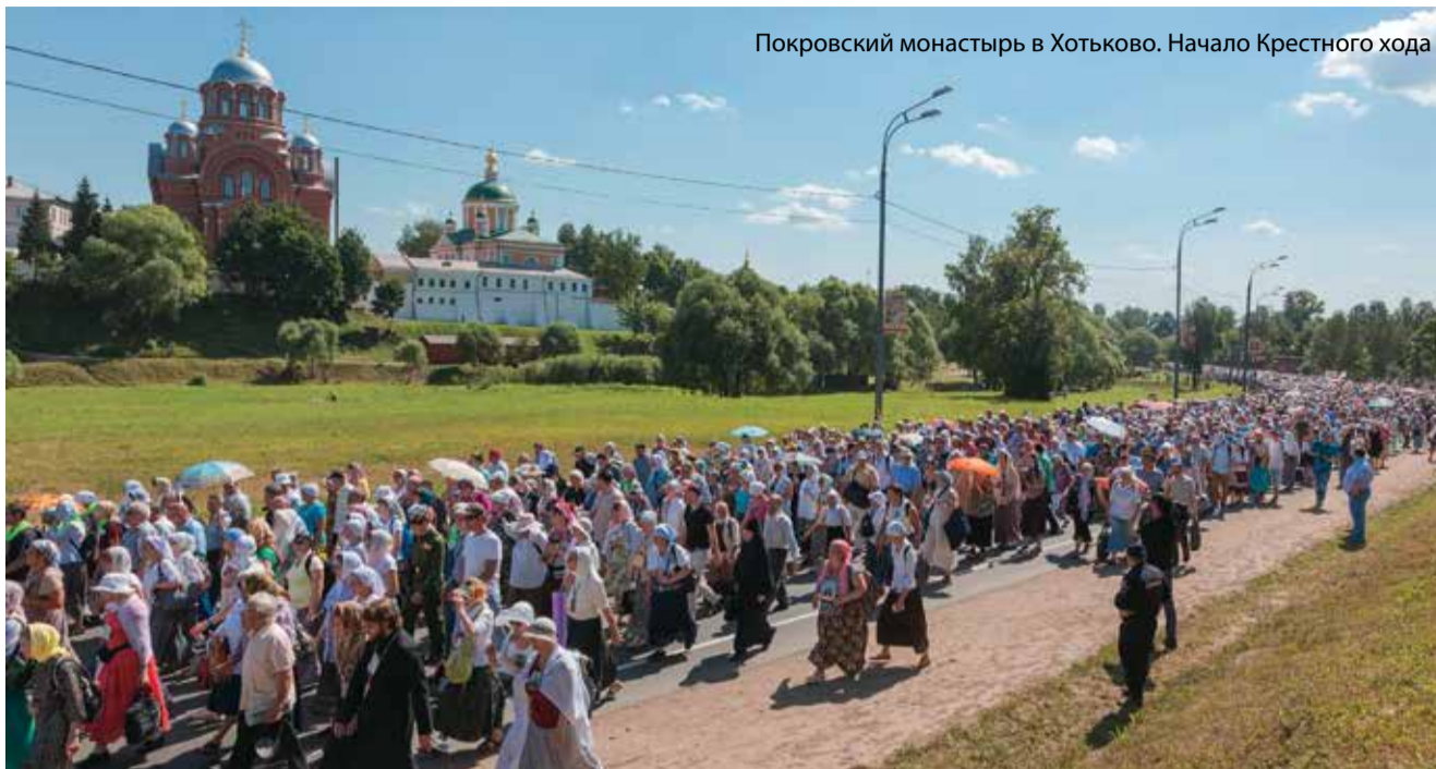
Покровский монастырь в Хотьково. Начало Крестного хода

с хоругвями и иконами в руках. По обочинам дорог стояли местные жители. Они выносили воду паломникам, а кто-то даже обливал их колодезной водой.