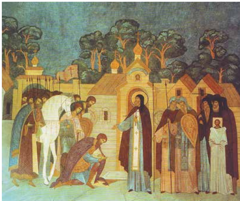
Фрагмент росписи Серапионовой палаты «Благословение преподобным Сергием князя Дмитрия Донского с дружиной»

На Дон пришли шестого сентября. Вставала яркая холодная заря, Но одолели Дмитрия сомненья. И осторожно старые князья Советовали ждать здесь пополненья.