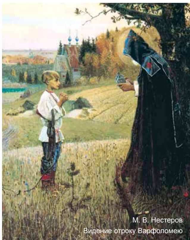
М. В. Нестеров Видение отроку Варфоломею