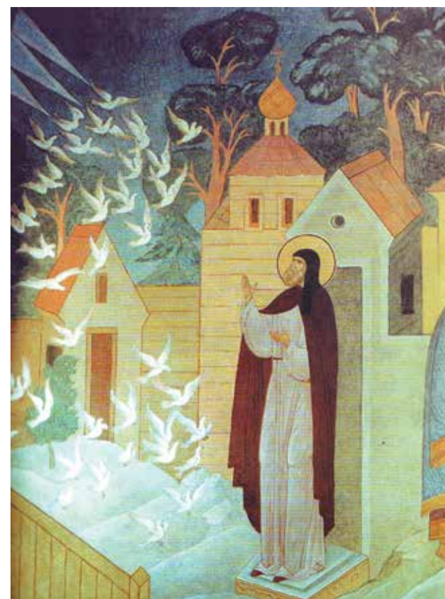
Фрагмент росписи Серапионовой палаты «Видение птиц преподобному Сергию»

Но тут пришло от Сергия посланье: — Не бойся ничего, иди вперёд! Тебя Святая Троица спасёт!