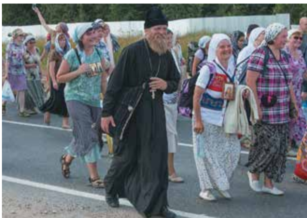
Настроение у всех было праздничное

с хоругвями и иконами в руках. По обочинам дорог стояли местные жители. Они выносили воду паломникам, а кто-то даже обливал их колодезной водой.