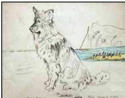
Ф. Конохов. «Вожак Иркутт». 1980 г.

пришли. Это очень для меня дорого. Я люблю вас!» И это чувствуется! Но и теперь мы силится увидеть что-то ещё более важное, сокровенное.