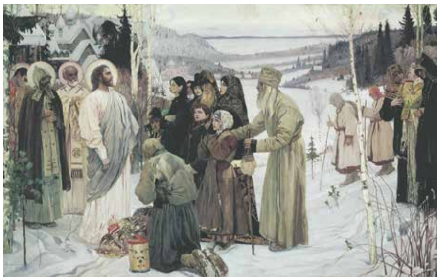
М.В. Нестеров. «Святая Русь»