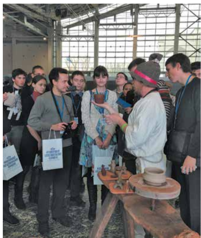
Наша команда отвечает на вопросы гончара

Материал подготовила Татьяна Жолобнюк