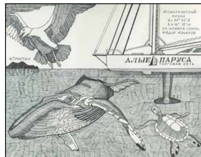
Ф. Конюхов. «Алые Паруса». 2007 г.

как-то о себе отец Фёдор, я родился не для лёгкой жизни, а для наслаждения ею через преодоление трудностей».