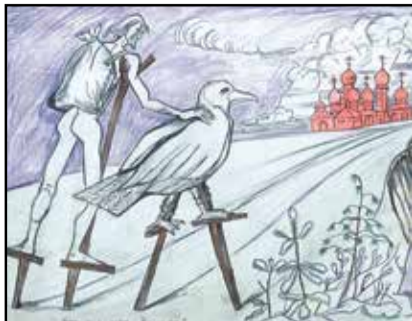
Ф. Конохов. «Вот она – моя Россия». 1997 г.