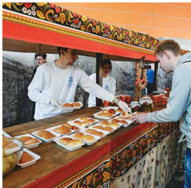
Ватрушки, баранки, мочёные яблочки

интересно испытать свои силы, и мы дали на это согласие. Нашей команде был задан ряд вопросов, посвящённых разным периодам истории России и Русской Православной Церкви. Со всеми вопросами мы успешно справились, за что нам присудили второе место и наградили подарочными картами магазина «Республика».