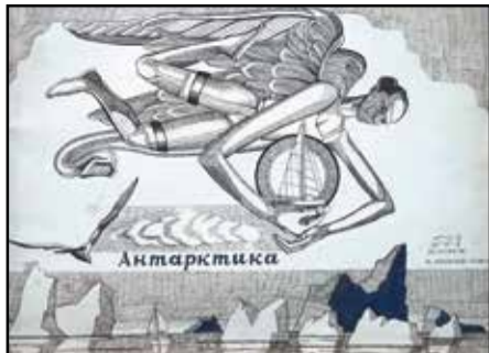
Ф. Конохов. «Антарктика». 2008 г.