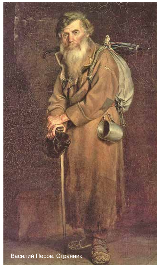
Василий Перов. Странник

Не одобряя бесплодных скитаний с одного места на другое, хотя бы, по-видимому,