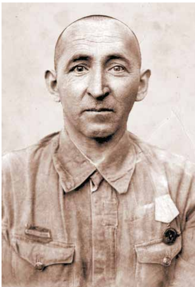
Фото после госпиталя, февраль 1944 года