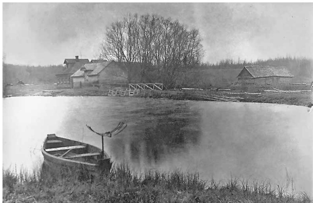
Река Шáха. Вид на Савельевскую водяную мельницу. Октябрь 1934 г.