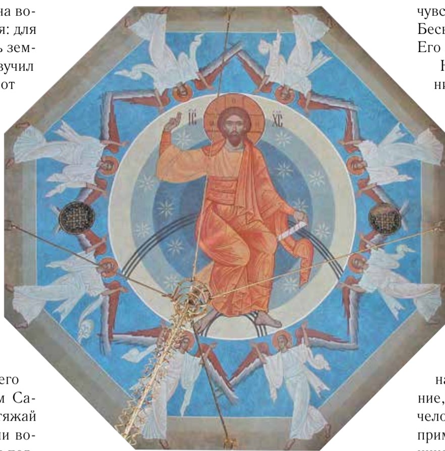
«Вознесение». Фрагмент росписи Богородицерождественского храма в Костино

Итак, совместно с Богом человек отправляется в путь к намеченной цели — спасению. Но все люди разные, одинаковых не бывает. И кто-то уверен, что состоит из одного только тела, и отрицает наличие души. Она, конечно, у него есть. Ведь она даётся Богом каждому человеку в момент его зачатия. Но кто её тогда ощущает? И даже прожив много лет, человек может по-прежнему пребывать в уверенности, что никакой души не существует, поскольку не чувствует её, не знает, где она у него. Однажды на будущих космонавтах поставили эксперимент. Крепких мужчин, спортсменов, уложили на больничные койки, чтобы они довольно длительное время не шевелились. И что же? Когда им позволили встать, они не смогли не только ходить, но даже стоять на ногах! Мышцы атрофировались. Пришлось их заново учить ходить. Поэтому теперь на космических кораблях предусматривают специальные тренажёры, чтобы люди там двигались.