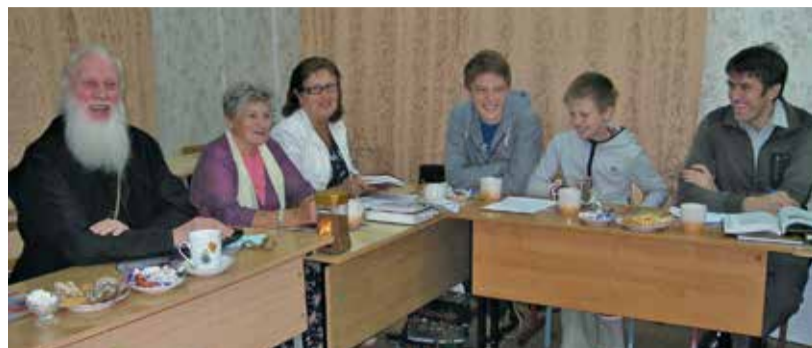
Встреча в Молодёжном клубе 12 июля 2015 г.

Участники наших встреч читали по ролям два рассказа А.П. Чехова «О любви» и «Как я вступил в законный брак». Произведения очень разные, но они объединены общими вопросами любви, долга и, в конечном счёте, человеческого счастья.