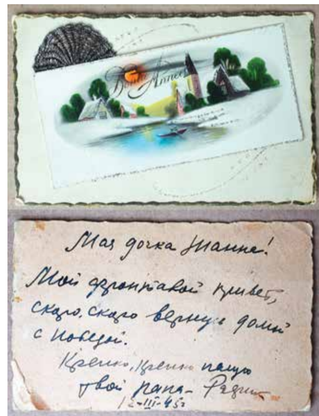
Открытка с фронта, март 1945 года