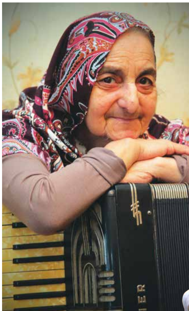
С папиным аккордеоном