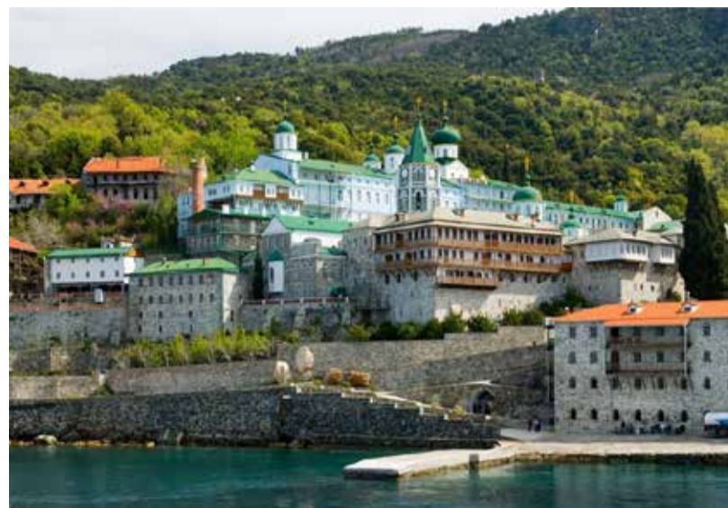
Русский на Афоне Свято-Пантелеимонов монастырь

Тогда от старцев Протата (местного синода, состоящего из представителей всех двадцати