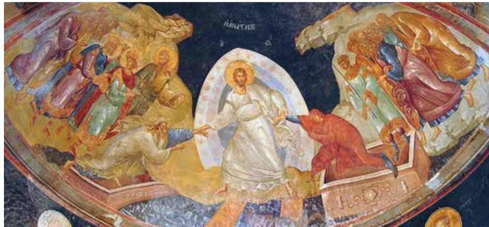
Сошествие Христа во ад. Фреска монастыря Хора, Константинополь. XIV в.

Господь воскрес воистину. Господь преображает людей, изменяет их. Когда Его любовь войдёт в душу, всё изменяется, человек преображается, умиротворяется, меняется его душа, ум. У него есть желание жить, есть желание трудиться, идти вперёд — всё это даёт Христос. Ты будешь жаждать Божией любви, которую Бог будет подавать тебе призывательно.