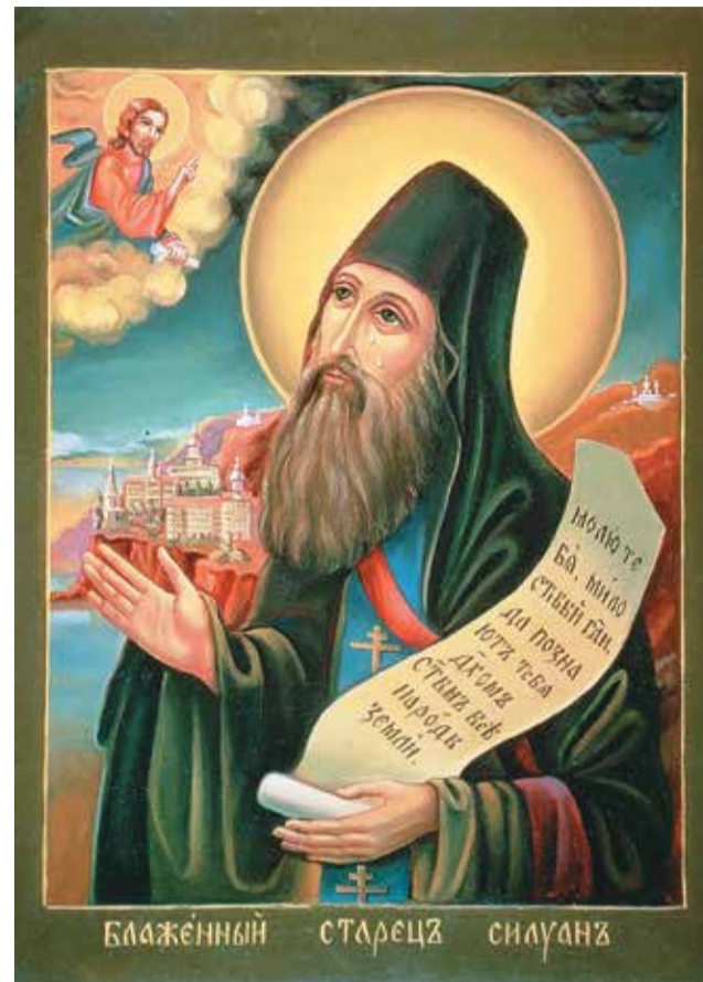
БЛАЖЕННЫЙ СТАРЕЦЪ СИЛУАНЪ

Если ум твой хочет молиться в сердце и не может, то читай молитву устами и держи ум в словах молитвы, как говорит «Лествица». Со временем Господь даст тебе сердечную молитву без помыслов, и будешь легко молиться. Некоторые повредили себе сердце, потому что усиливались умом