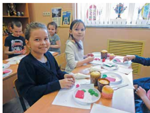
Старались все — и девочки...