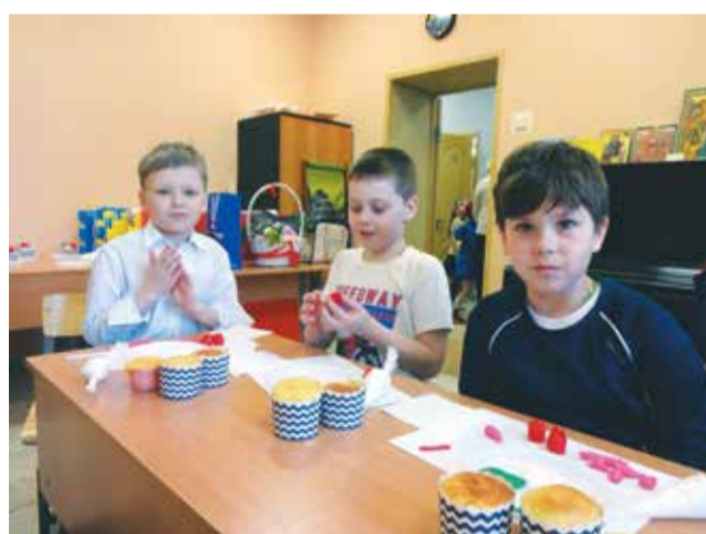
... и мальчики!