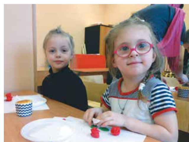
Получилось даже у малышей!