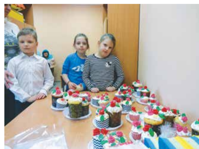
Плоды общего труда