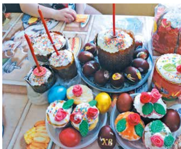
Красота — своими руками!