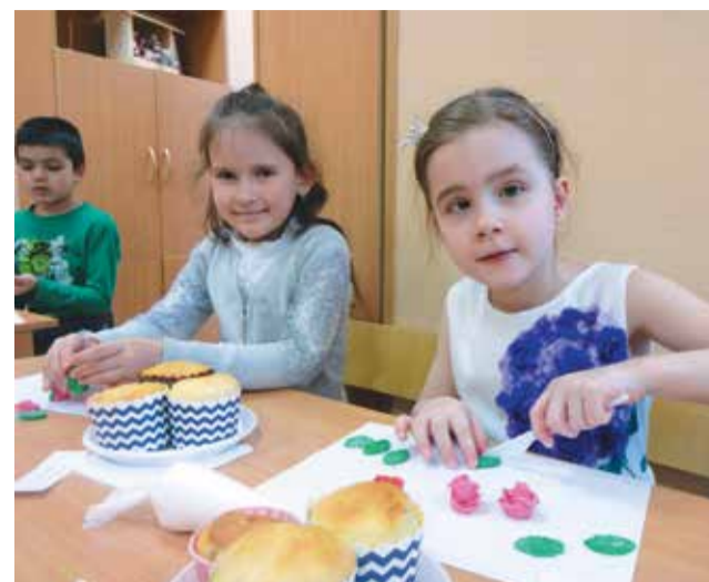
Учимся делать розочки