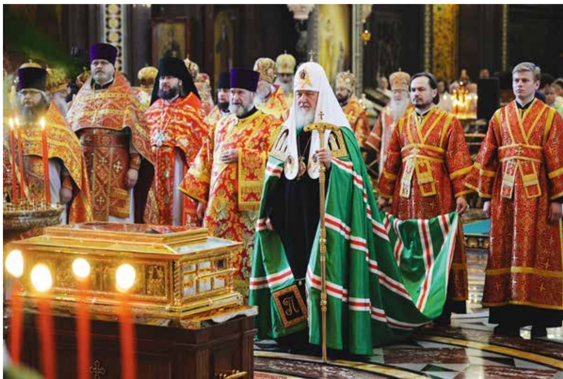
В Храме Христа Спасителя, 21 мая 2017 года

На чём же основывается такое почитание святителя Николая в нашем народе? Всякое религиозное почитание связано с очень важным явлением — с ответом, который верующий человек получает, обращаясь к небесам. В сознании нашего народа, в его исторической памяти запечатлено множество чудес, дивных деяний, которые совершались в личной и общественной жизни благодаря молитвам святителю и чудотворцу Николаю. Вот почему русская паства — это паства, исполненная огромной любви к святителю и чудотворцу