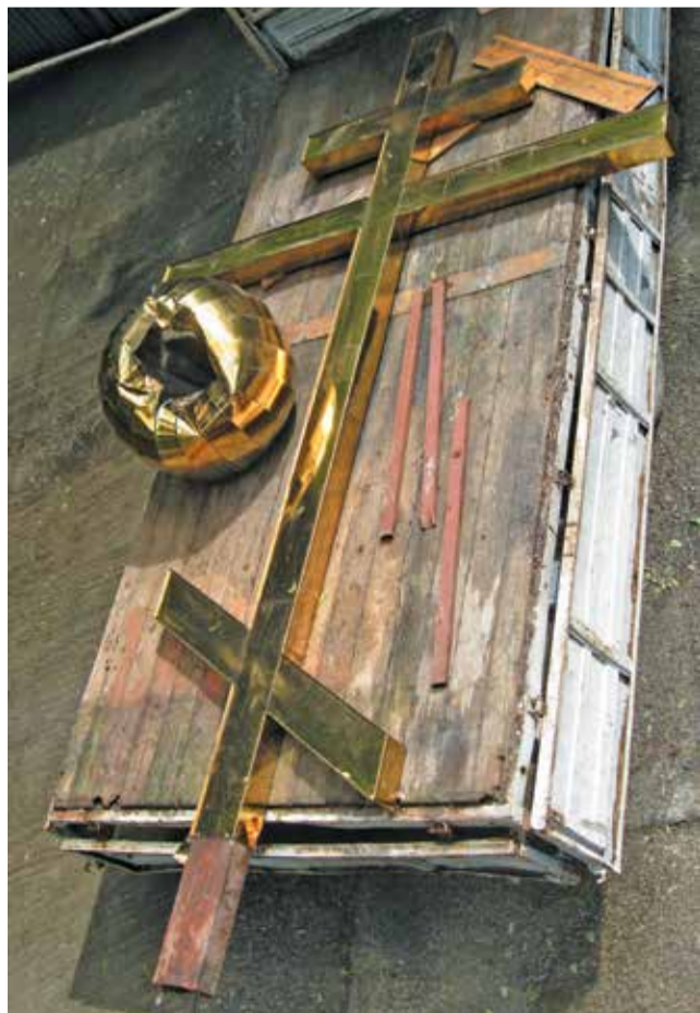
Крест после демонтажа, 30 мая 2017 года

Потом побежали годы. Жители уже стали привыкать и спокойно, с чувством сдержанного достоинства и благодарности, смотрели на белокаменного красавца, прописавшегося в городе, с голубыми главками и шатром, напоминающими, что храм этот — богородичный, посвящённый, ни много ни мало, — Её Рождеству.