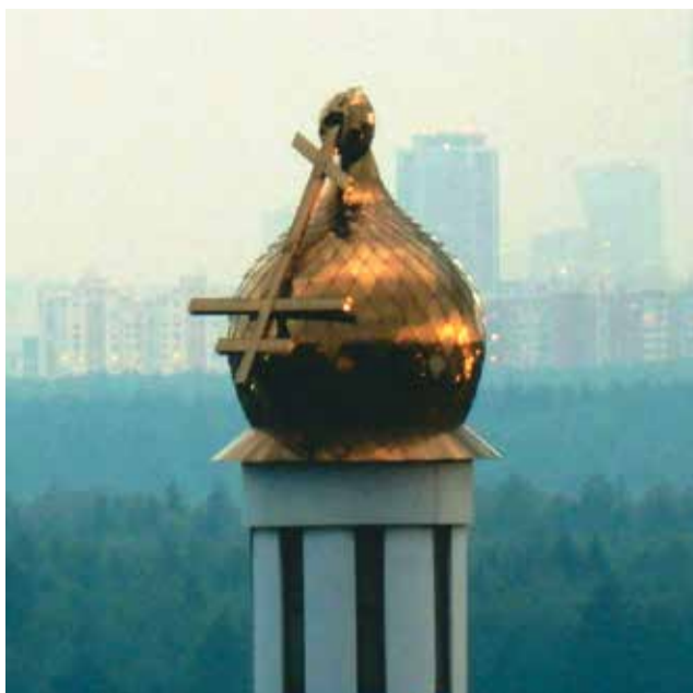
29 мая 2017 года

А потом вдруг в душе зашевелилась тревога, смешанная с каким-то недоумением: то ли кажется, то ли, в самом деле? Крест-то над шатром — того? Как будто чуть-чуть накренился. — «Да неужели?» — «Точно!» — «Невероятно! Может, оптический обман?» — «Может, ... но не похоже». — «А что же тогда?»