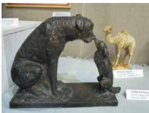
Вячеслав Пилипер. Скульптура «Любовь»