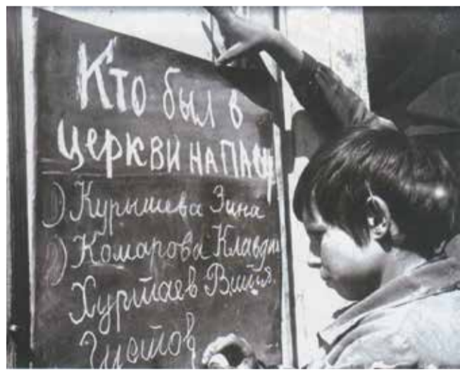
Доска позора в школе