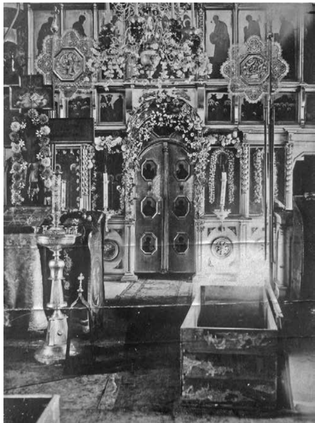
Внутренний вид храма, июнь 1931 г.

В Государственном архиве Российской Федерации, в фонде Всероссийского центрального исполнительного комитета, обнаружилось дело (Фонд 1235, опись 75, дело 1789) о том, как прихожане пытались вернуть храм. Об этой попытке в деле о закрытии храма в Центральном государственном архиве Московской области документов не было. Само дело в ГАРФе представляет собой смесь документов о закрытии храмов в сёлах с названием «Костино» Мытищинского и Рузского районов, поскольку отправители документов во ВЦИК зачастую не полностью указывали, о каких именно храмах каких сёл и районов идёт речь, а делопроизводители ВЦИК подшивали их, не разбираясь, в одно дело.