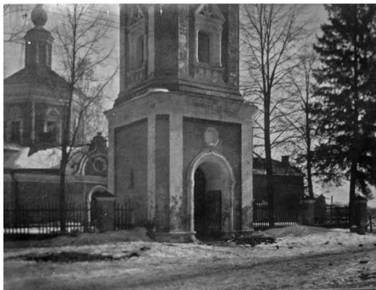
Богородицерождественский храм с колокольней, июнь 1931 г.

Дело затягивается до середины 1931 года. В июне президиум райисполкома посылает в секретариат ВЦИК фотографии церкви снаружи и внутри здания. Возможно, вид разгромленного интерьера, почти ничем, кроме чудом сохранившегося запрестольного образа Воскресшего Христа, да поблёклых росписей стен, не напоминавшего, что здесь когда-то проходили бого-