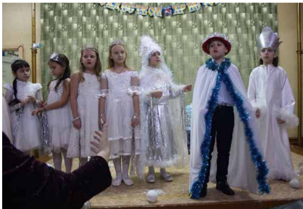
Спектакль «Ангел Рождества»