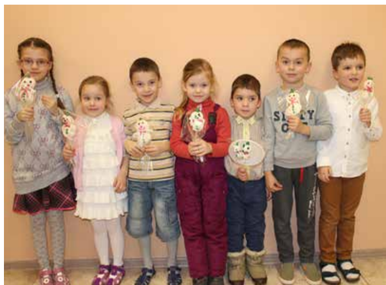
Улыбались и дети и снеговички

После праздничного спектакля дети пошли на чаепитие и мастер-класс. Им предстояло сделать сладкие подарки из домашнего яблочного зефира. У всех получились очень милые, нарядные, улыбочивые съедобные снеговички!