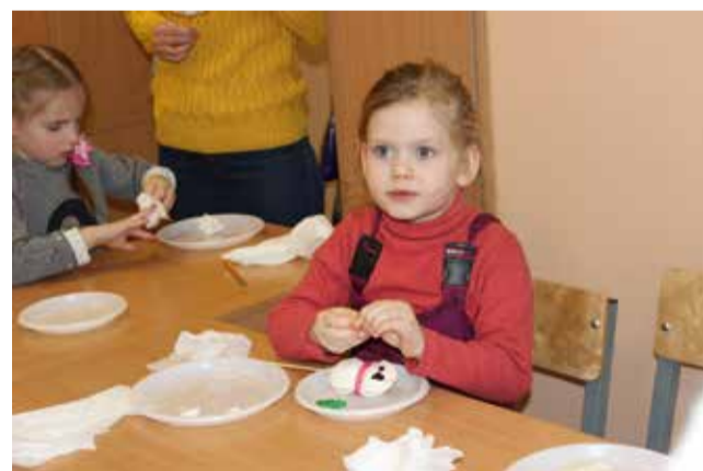
Лепим из зефира

присутствующих были совершенно новыми. Такие подробности можно узнать, лишь пообщавшись с