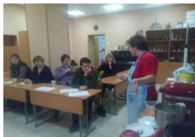
Мамы тоже учатся