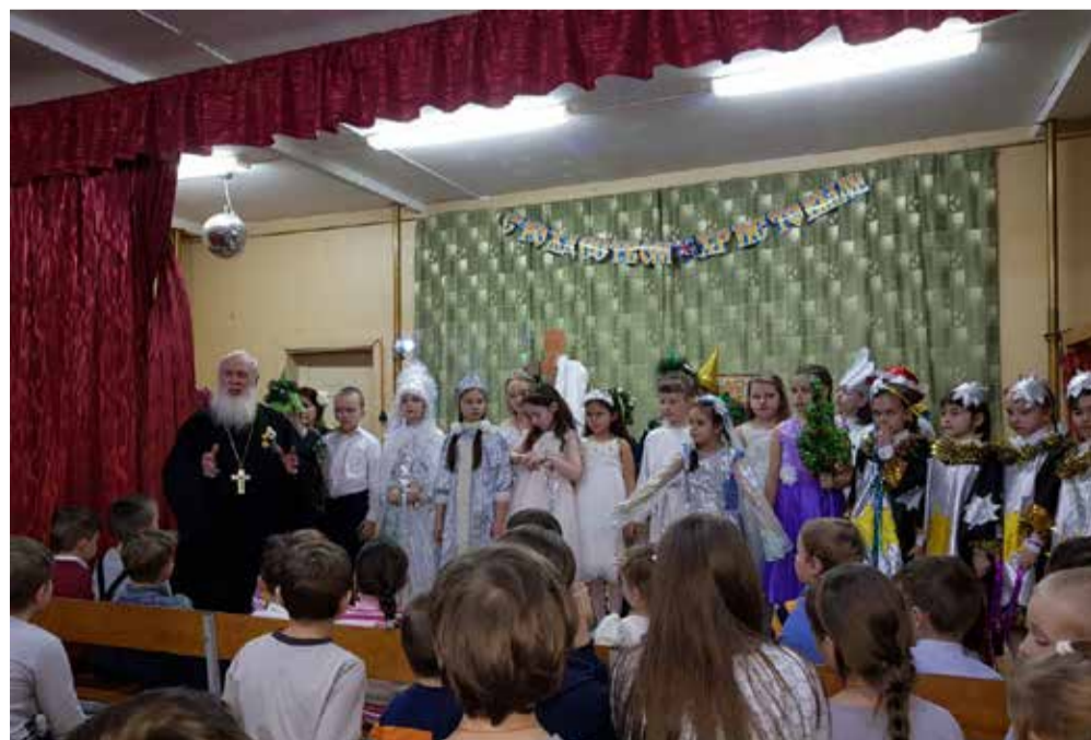
Поздравление от настоятеля храма