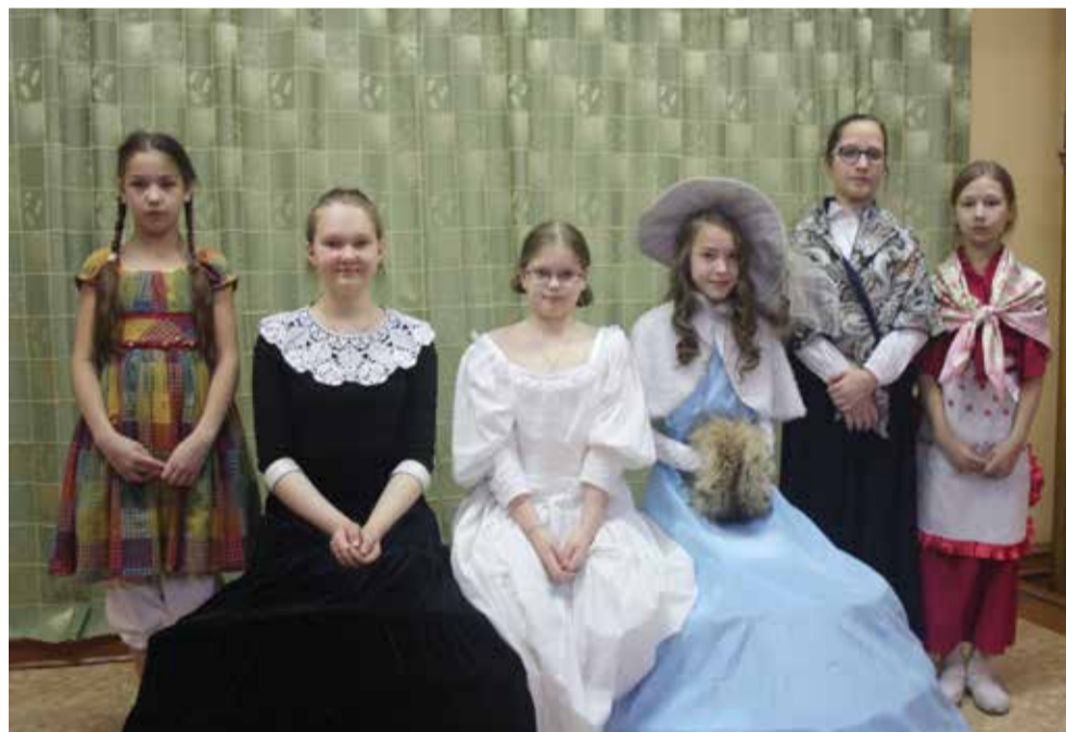
Участники спектакля «Рождественское чудо»