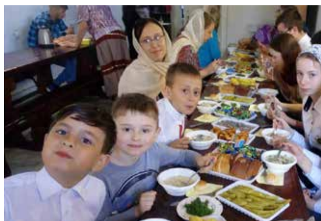
В трапезной храма

Дорогие прихожане! Своими впечатлениями о паломнических поездках вы можете поделиться на страницах нашей газеты. Свои рассказы оставляйте в храме за свечным ящиком или присылайте по адресу hramvkostino@yandex.ru с пометкой «для газеты».