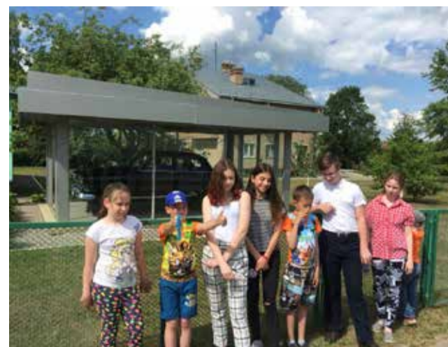
У машины Юрия Гагарина

нашу компанию на обед. Еда, которой нас угощали, была очень вкусной и сытной.