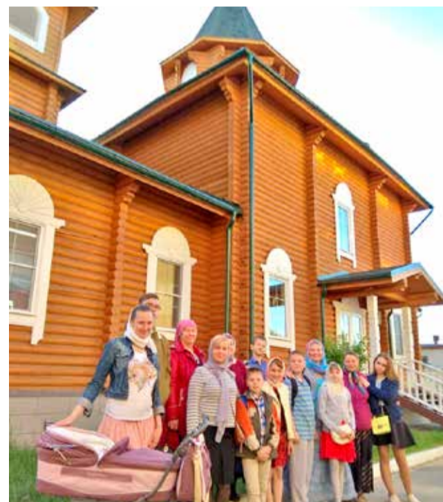
У храма преподобного Сергия

Просим ваших молитв и помощи в реставрации Усадьбы «Костино» и создании храмового комплекса Богородицержественского храма