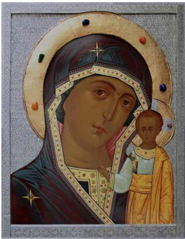
Казанская икона Пресвятой Богородицы. Богородицерожественский храм в Костино. Художник Дмитрий Лазарев

Этого умения, которого и от нас ждёт Господь, мы никак не можем достичь. На цыпочки встаём, стараемся изо всех сил, а достичь не можем. Божия Матерь любит всех без исключения, правых и неправых, а мы — нет. Мы хорошо различаем, кто прав и кто неправ. Кто прав — тех мы любим, и снисходительны к ним, дружим