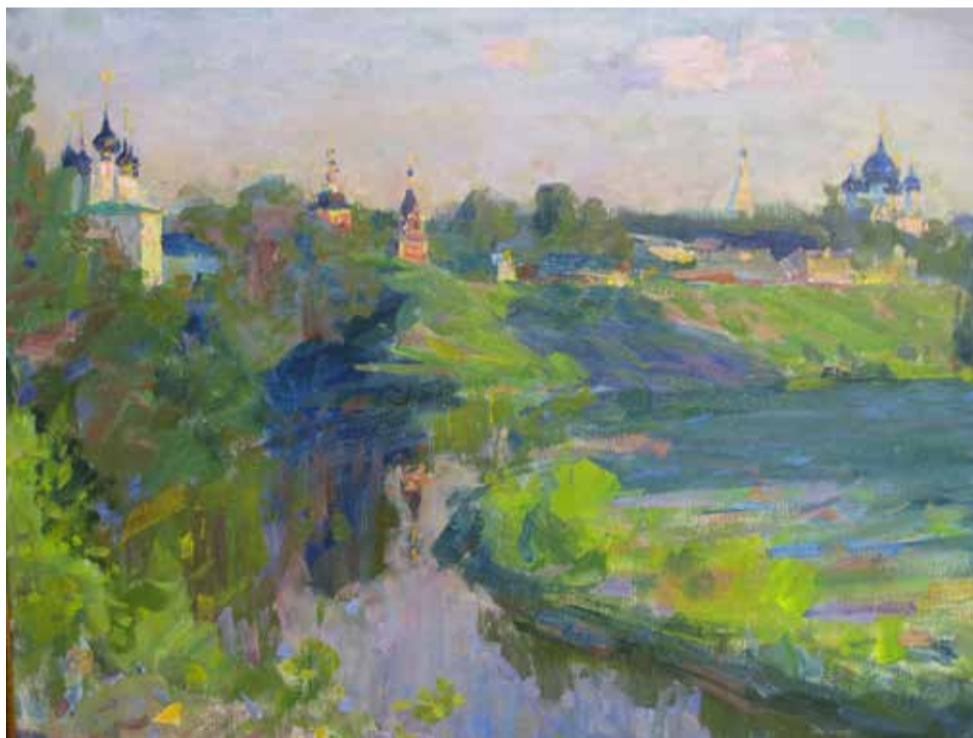
Сергей Артов. «Суздаль. Вечер»

Просим ваших молитв и помощи в реставрации Усадьбы «Костино» и создании храмового комплекса Богородицержествовского храма